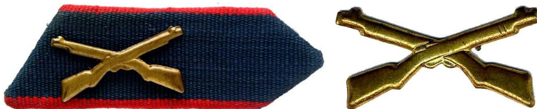
Gallérhajtóka és a hozzá tartozó „fegyvernemi” jelvény

A gallérhajtókán a két egymáson keresztben elhelyezett puskát láthatjuk melyet a Magyar Néphadsereg öltözködési utasítása 1949-ben vezet be, de a rendőrséget 1992 utánig elkíséri és jelképezi. A hajtóka megegyezik a váll-lap színével és korával, 1951-1956.