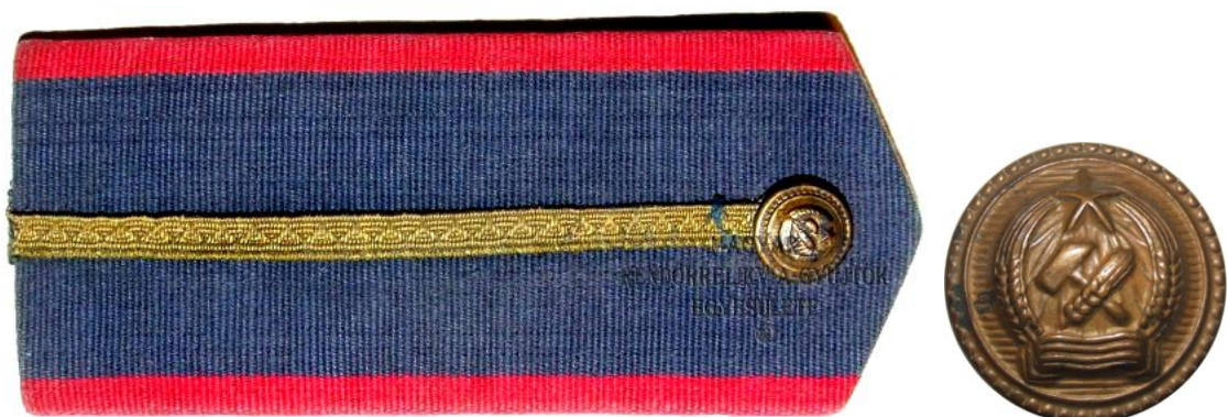
Tisztképző iskola és tiszti tanfolyamok hallgatóinak váll-lapja és a hozzá tartozó gomb (1951-1956)

A lengő váll-lapok az úgynevezett „orosz” típusúak, közepén egy sávval. Megfejtése: Tisztképző iskola és tiszti tanfolyamok hallgatóinak váll-lapja 1951-1956. Innen már tudjuk az évszámot és a rejtett gombolású zubbonyának a színét, amely mélykék. A bal oldali váll-lap címeres tűzőgombja hiányzik, szabálytalan viselés, de gondolom a kép készítésekor ezt egyszerűen csak nem vették észre.