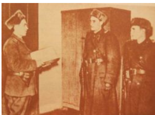
02. kép Szolgálatba induló Területfelelősök eligazítása.

A Belügyminiszter 9000-4/1952. számú utasítása alapján 1952. június 30.-án adták ki a Rendőrség új Szolgálati Szabályzatát, amelynek II. része már külön fejezetben és 29 pontban foglalta össze a területfelelősi szolgálattal kapcsolatos tudnivalókat. (03. kép)