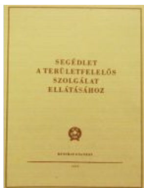
01. kép Segédlet a Területfelelős Szolgálat ellátásához (BM 1953)